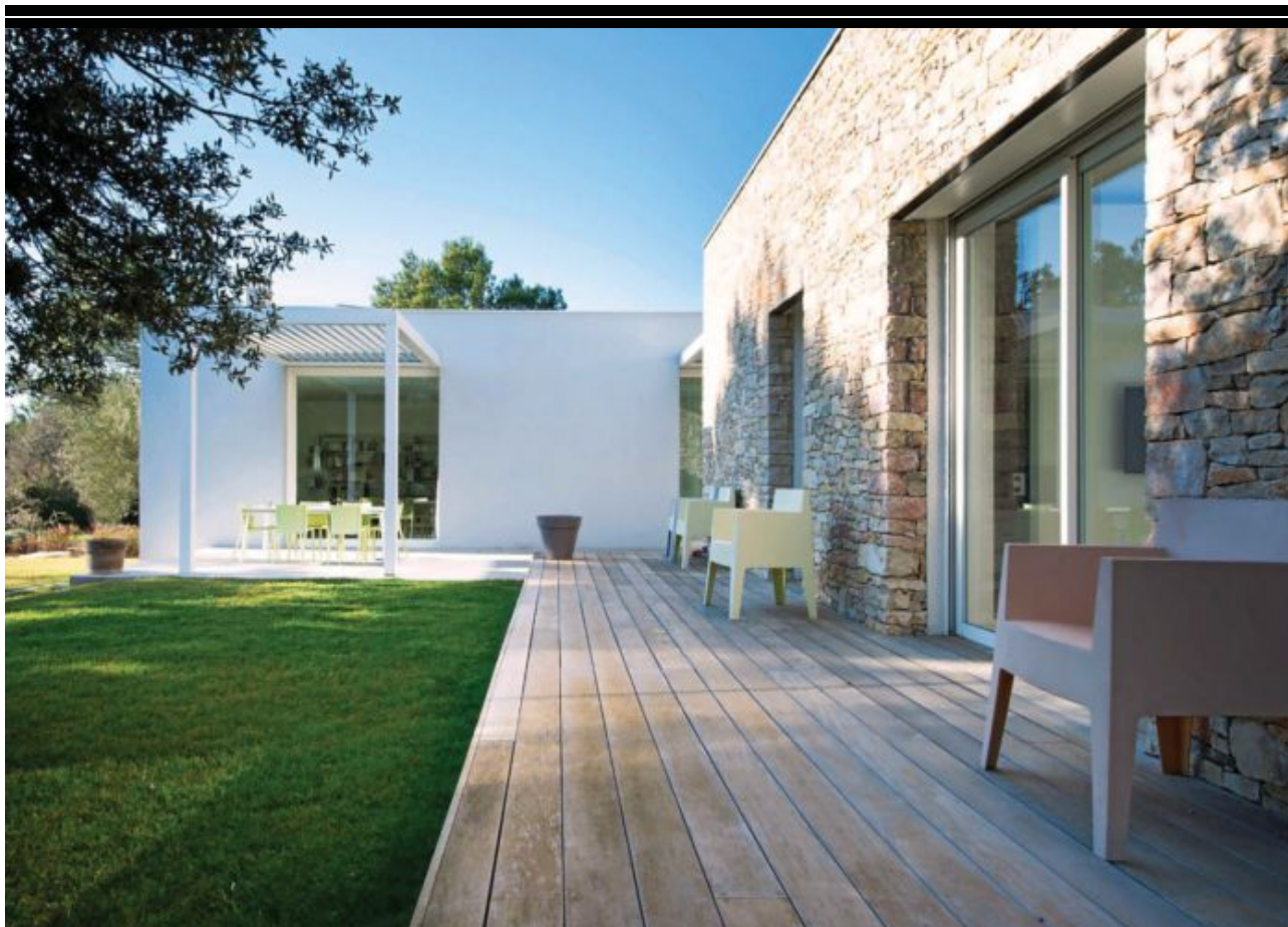
ESTILO RÚSTICO 'CHIC': Las 'nuevas' casas rurales juegan a mezclar elementos tradicionales, como madera y piedra, con un diseño contemporáneo. HOZZZ

TURISMO: ¿QUIERE ABRIR UNA CASA RURAL? SIGA ESTOS PASOS