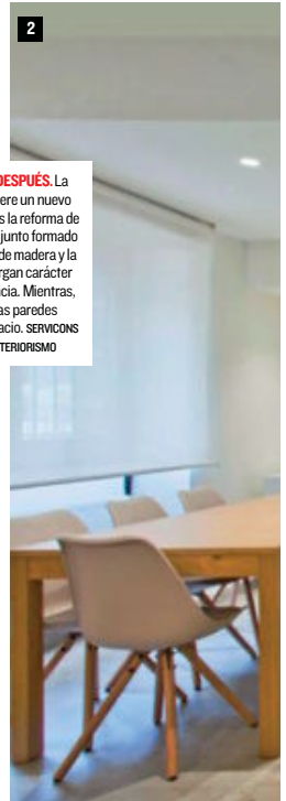
1 Y 2. ANTES Y DESPUÉS. La chimenea adquiere un nuevo protagonismo tras la reforma de este salón. El conjunto formado con los muebles de madera y la viga de forja otorgan carácter rústico a la estancia. Mientras, el blanco de las paredes moderniza el espacio. SERVICIOS REFORMAS & INTERIORISMO

➔ Estadística (INE), en 2017 había en España 17.596 viviendas rurales con capacidad para más de 172.000 turistas, lo que se traduce en una media de unas 10 plazas por alojamiento que dan trabajo a 27.400 personas. Por comunidades, Castilla y León, concentra, con 3.710 alojamientos, la mayor cantidad. El año pasado, más de cuatro millones de personas se alojaron en este tipo de establecimientos, de los que 3,23 millones eran ciudadanos españoles. Entre todos ellos superaron las 11 millones de pernoctaciones. Es decir, cada turista, de media, se alojó 2,75 noches en casas rurales, a un precio de unos 26 euros por noche. Castilla y León fue también el destino preferido, con más de 4,6 millones de pernoctaciones. Le siguen Andalucía (1,21 millones) y Cataluña (1,19 millones). En total, el turismo rural factura unos 200 millones de euros al año.