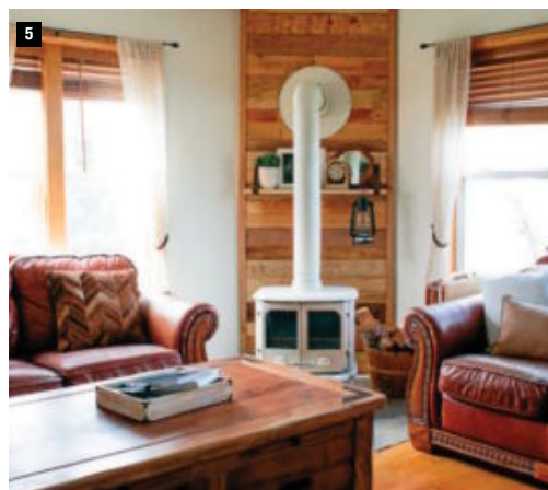
3. BAÑO. La recuperación de elementos antiguos, el color azul de las paredes y el uso de contraventanas restauradas como elementos decorativos ayudan a crear una atmósfera de relajación. 4. EXTERIOR. La pared revestida en piedra y la proliferación de plantas contribuyen a dotar de un aire rústico a esta vivienda de nueva construcción. 5. SALÓN. La combinación de madera en varios elementos y los sofás de piel aportan calidez a esta estancia. Asimismo, la chimenea de estilo 'vintage' ayuda a reforzar esta sensación. HOZZ

incendios, accesibilidad, abastecimiento de aguas y saneamiento.